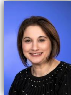
2 Akar, Pembe 53545 Linz am Rhein