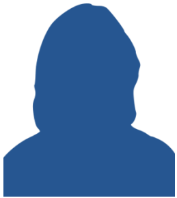
13 Nissan, Woroud 56564 Neuwied